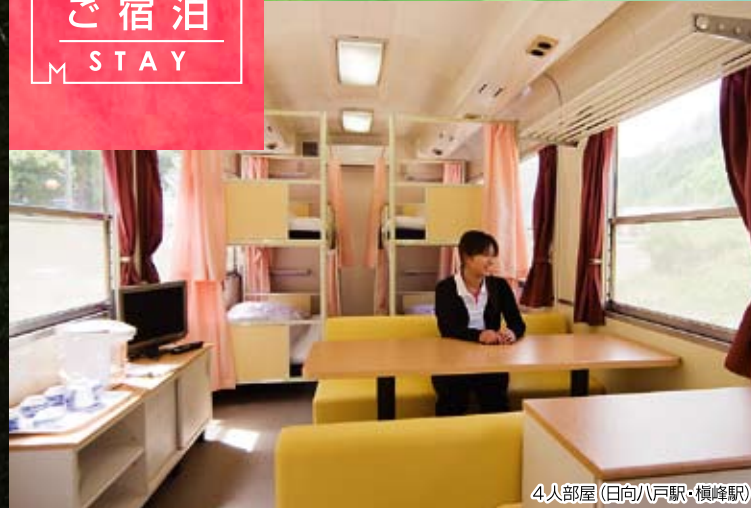
4人部屋(日向八戸駅・横峰駅)