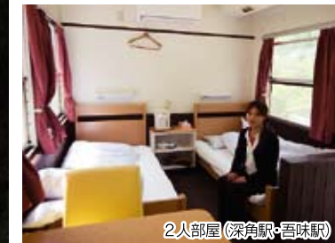
2人部屋(深角駅・吾味駅)